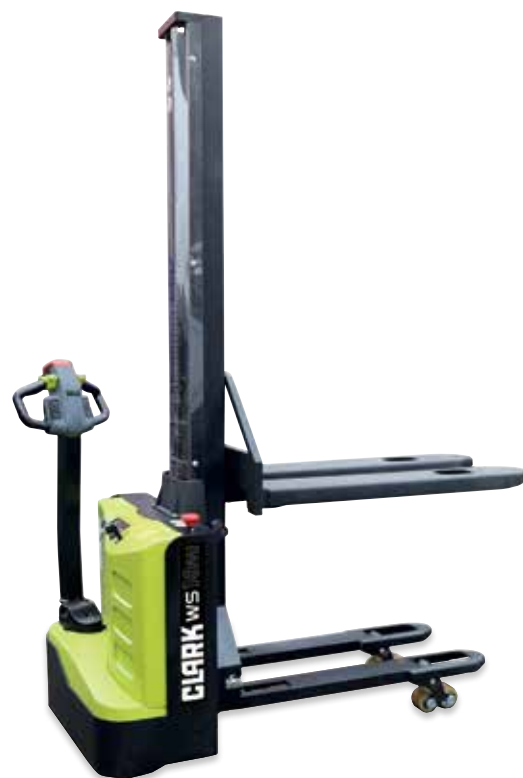
WS10M(i) Mono-Mat avec levée initiale