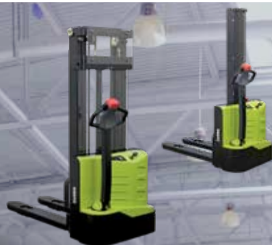
WS10 | WS10M(i)

les espaces confinés. Vous avez besoin d'un gerbeur à conducteur accompagnant ou, pour des distances plus longues, d'un gerbeur avec une plateforme pour conducteur porté ? Aucun problème : CLARK propose le modèle de gerbeur électrique à conducteur accompagnant adapté à presque toutes les exigences.