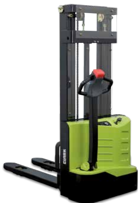
WS10 Mat Standard

Nos modèles d'entrée de gamme sont pour tous ceux qui veulent accomplir des tâches simples sans aucun effort.