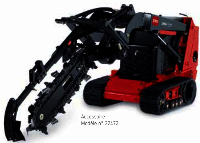
Accessoire Modèle n° 22473