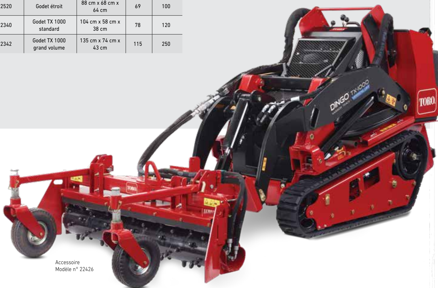
Accessoire Modèle n° 22426