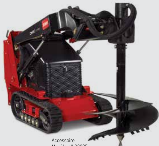
Accessoire Modèle n° 22805

Les utilisations du Dingo de Toro® et de ses divers outils ne connaissent d'autre limite que votre imagination.