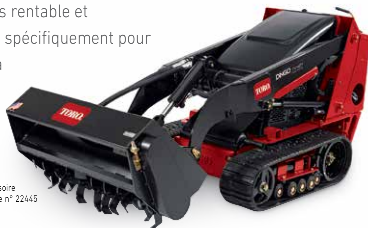
Accessoire Modèle n° 22445

Le large éventail d'accessoires rend le Dingo® plus rentable et économique qu'un équipement spécialisé. Conçus spécifiquement pour le Dingo, ces accessoires Toro® d'origine offrent la meilleure assurance d'une longue durée de vie et de performances optimales.