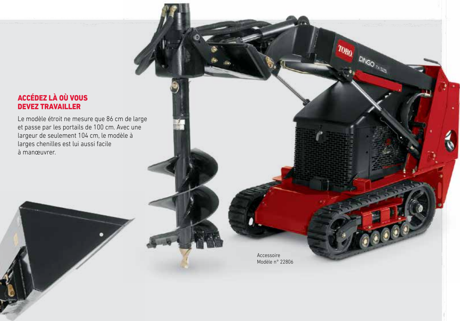
Accessoire Modèle n° 22806

Le modèle étroit ne mesure que 86 cm de large et passe par les portails de 100 cm. Avec une largeur de seulement 104 cm, le modèle à larges chenilles est lui aussi facile à manœuvrer.