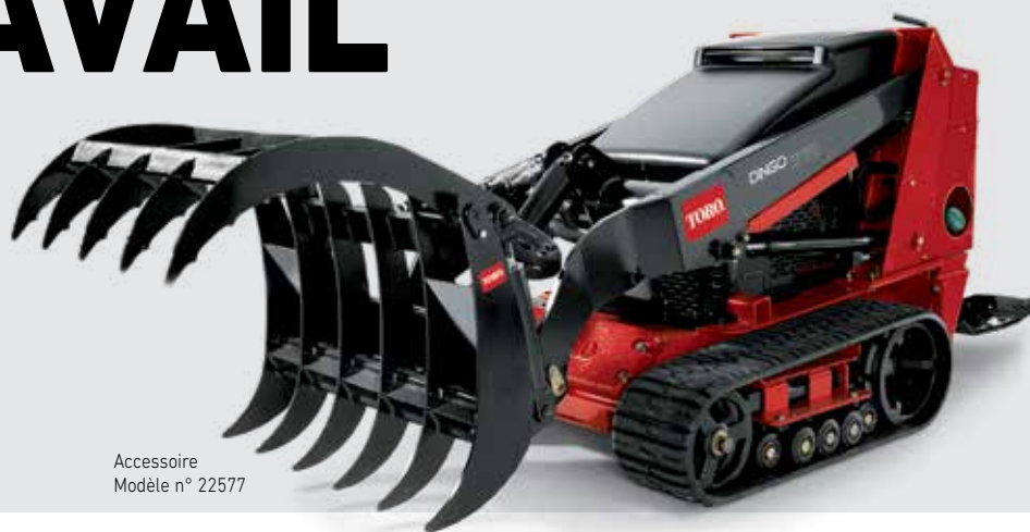
Accessoire Modèle n° 22577